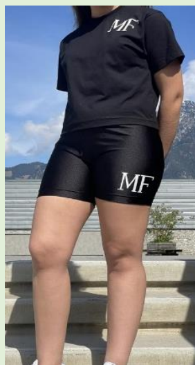
Das eigene Sportdress